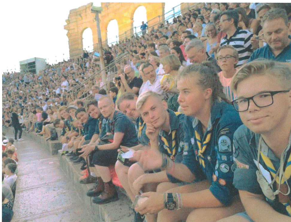
Arken på operan i Verona.

Efter några veckors vila, gick flera av oss Hajk-DM, som en introduktionshajk för de nya utmanarna som kom upp till oss efter sommaren. Arken placerade sig på en hedrande bronsplats i utmanarklassen! Grymt jobbat! Flera var med på RUT-arrangemanget scoutbalen som hölls i Backa. Dessutom åkte vi till Göteborg och testade på Escape House, där man fick samarbeta i grupper för att lyckas lösa uppgifter och ta sig ut ur låsta rum. Lite senare under hösten deltog vi som försökspersoner på ett projekt kallat Action on Body Confidence där två representanter från distriktet lärde oss om idealsamhället vi lever i.