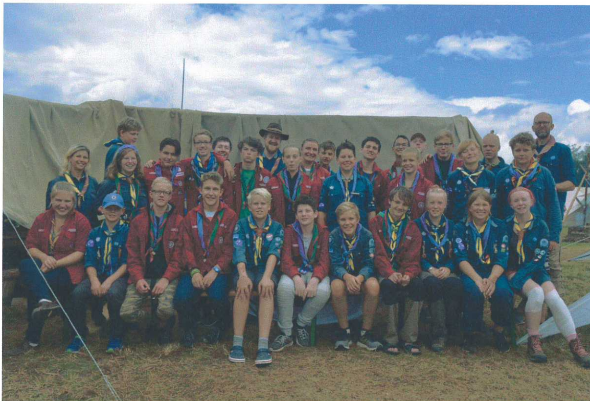
Äventyrare med österrikiska vänscouters vid HOME2018.

Årets höjdpunkt var deltagandet i det österrikiska lägret HOME2018 där 14 scouter och 3 ledare deltog från kåren. Resan gjordes med tåg och vi besökte bl a koncentrationslägermuseet i Dachau på vägen dit. Efter lägret hade scouterna 3 dagar i en österrikisk familj, på s k Home Hospitality, vilket var fenomenalt om man får tro scouterna. Delar av resan gjordes tillsammans med utmanarna. Resan förbereddes under våren bl a genom märkestagning Världen där man tar kontakt med scouter i andra länder för att lära sig om andra kulturer och scouting. Vi fick också besök av en person vars föräldrar överlevt Förintelsen. Detta som en förberedelse för vårt besök i Dachau.