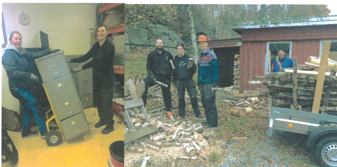
Glada föräldrar på arbetsdagen byggde om i förrådet och röjde slånor och fixade med veden.

En arbetsdag med stort deltagande av föräldrar hölls under hösten i scoutstugan. Hyllor byggdes i förrådet och materialrum samt vind röjdes. Material som gick att återanvända skänktes till second hand. Arkivmaterial har gått igenom och flyttats till förrådet i stora salen.