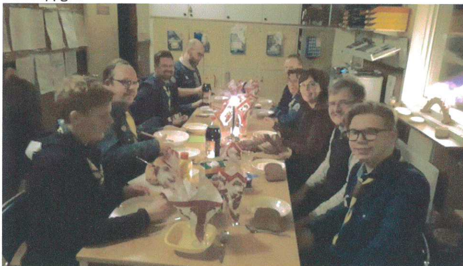
Arararat avslutar året med grötfest.

Året avslutades med en klassisk grötfest i scoutstugan som föregicks av en surring-livlineuppgift.