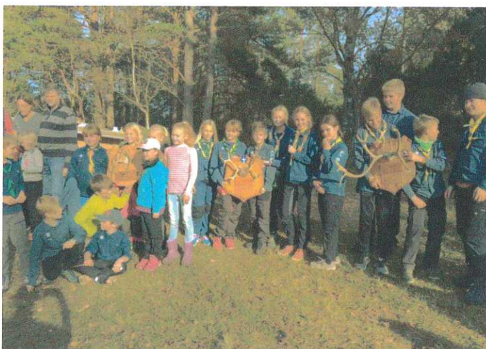
Spårare, Upptäckare och Äventyrare vid årets Kampen om Hornet.

Vi har deltagit i kårens gemensamma aktiviteter, det mycket uppskattade vårlägre "FYLKE" med Sagan om ringen tema, kårens årliga tunnbrödsbak med försäljning på torget samt vinterövernattningen i feb/mars. Upptäckarna deltog i Kampen om Hornet och segrade!