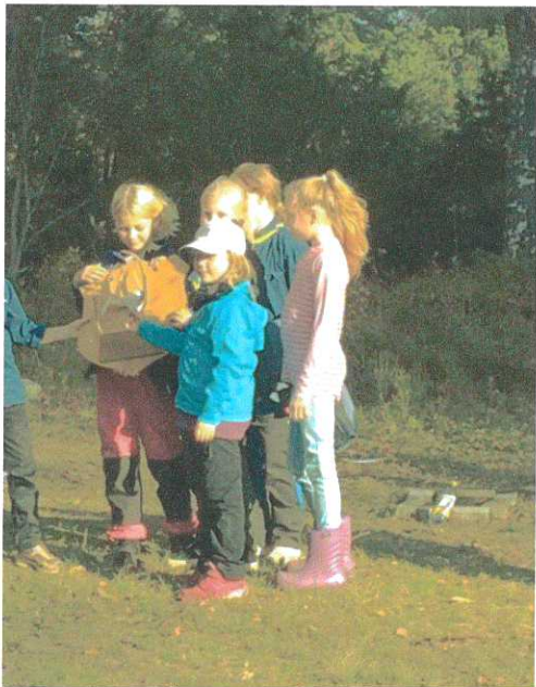
Vinnande Spårare vid årets Kampen om Hornet.

Tidigare år har maxantal scouter legat på 20, under hösten 2018 blev det så många som ville börja att vi beslutade om att utöka avdelningen till 25 stycken. Trots en utökad avdelning var det fortfarande många som ville börja, kölista finns nu etablerad i kåren via scoutnetför att hantera detta på bästa sätt.