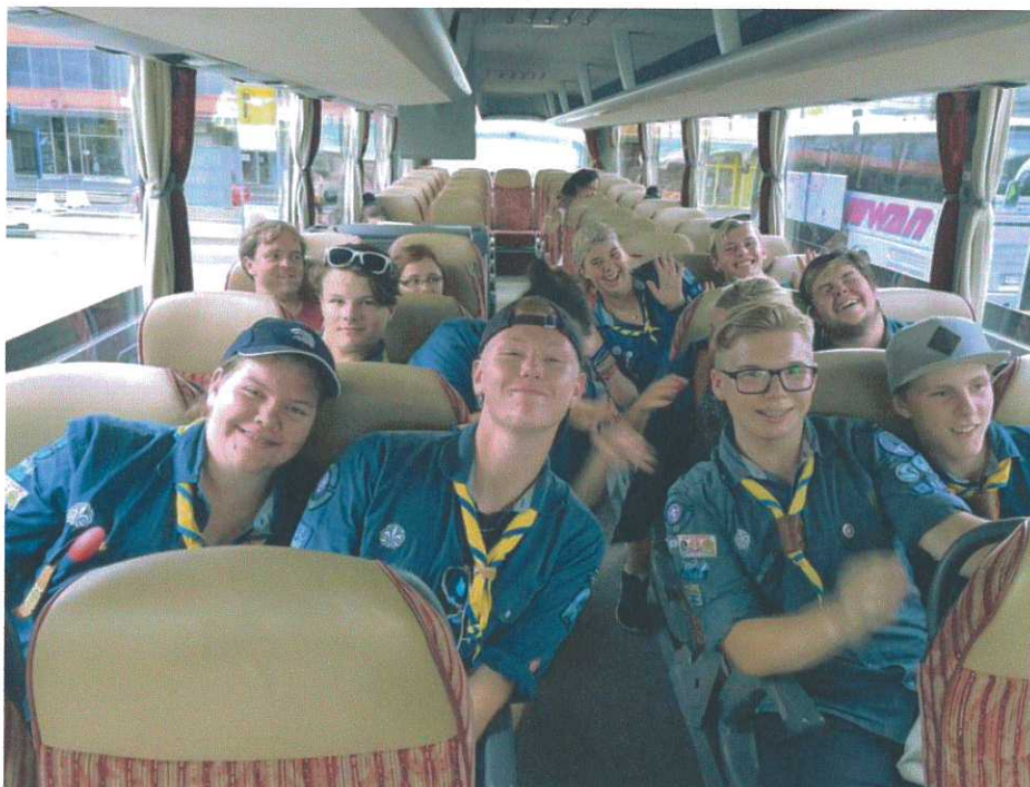
Arken på bussen.

Efter det fortsatte resan mot de slovenska alperna, till den lilla byn Bovec. Vi tältade på ett äventyrscamp och fick bland annat testa på canyoning, rafting och att åka zip line.