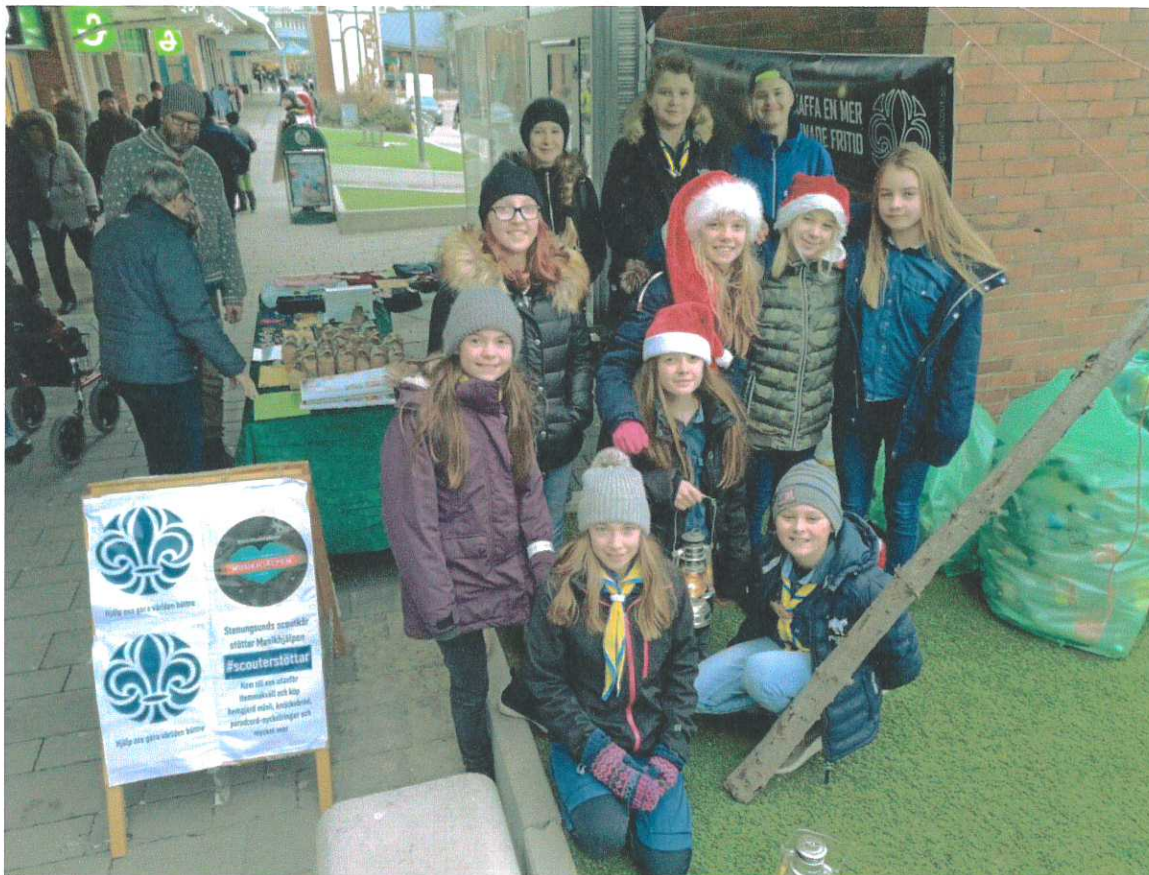
Aventyrarnas insamling till Musikhjälpen 2018 på Stenungs Torg.

Medlemsantalet under året har ökat. Vi har haft flera scouter som börjat som helt nya utan att ha gått i scouterna förut. Vid årets slut var vi 31 scouter och en liten men tapper skara på 4 ledare. Vi fick under året hjälp med ledare från andra avdelningar för att kunna genomföra vårt program.